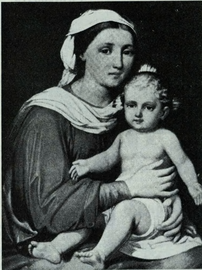
S. MARIA DELLE GRAZIE (Caprile). Questa immagine della Madonna è tanto cara e venerata dalla nostra gente agordina. Il Santuario di S. Maria delle Grazie, che dal 1654 è meta di pellegrinaggi da tutte le vallate, è stato scelto come luogo privilegiato d'incontri e di preghiera, per quest'anno mariano.